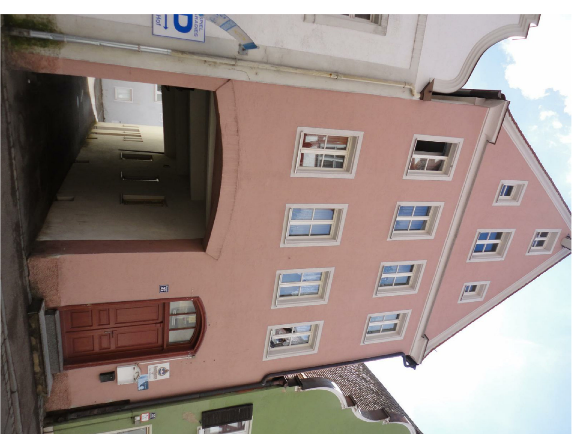
Anwesen Schloßstr. 35