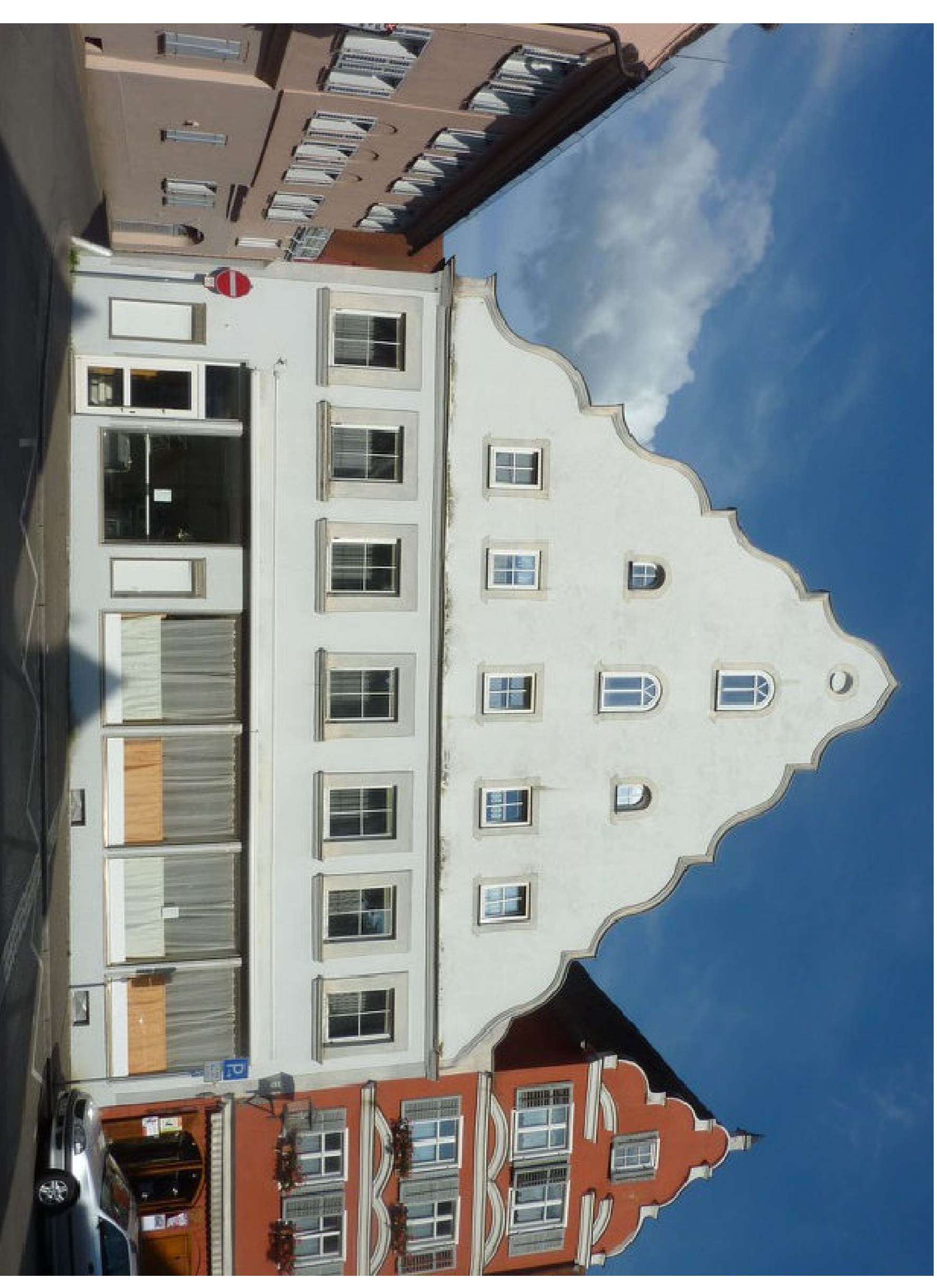
Anwesen Schloßstr. 25