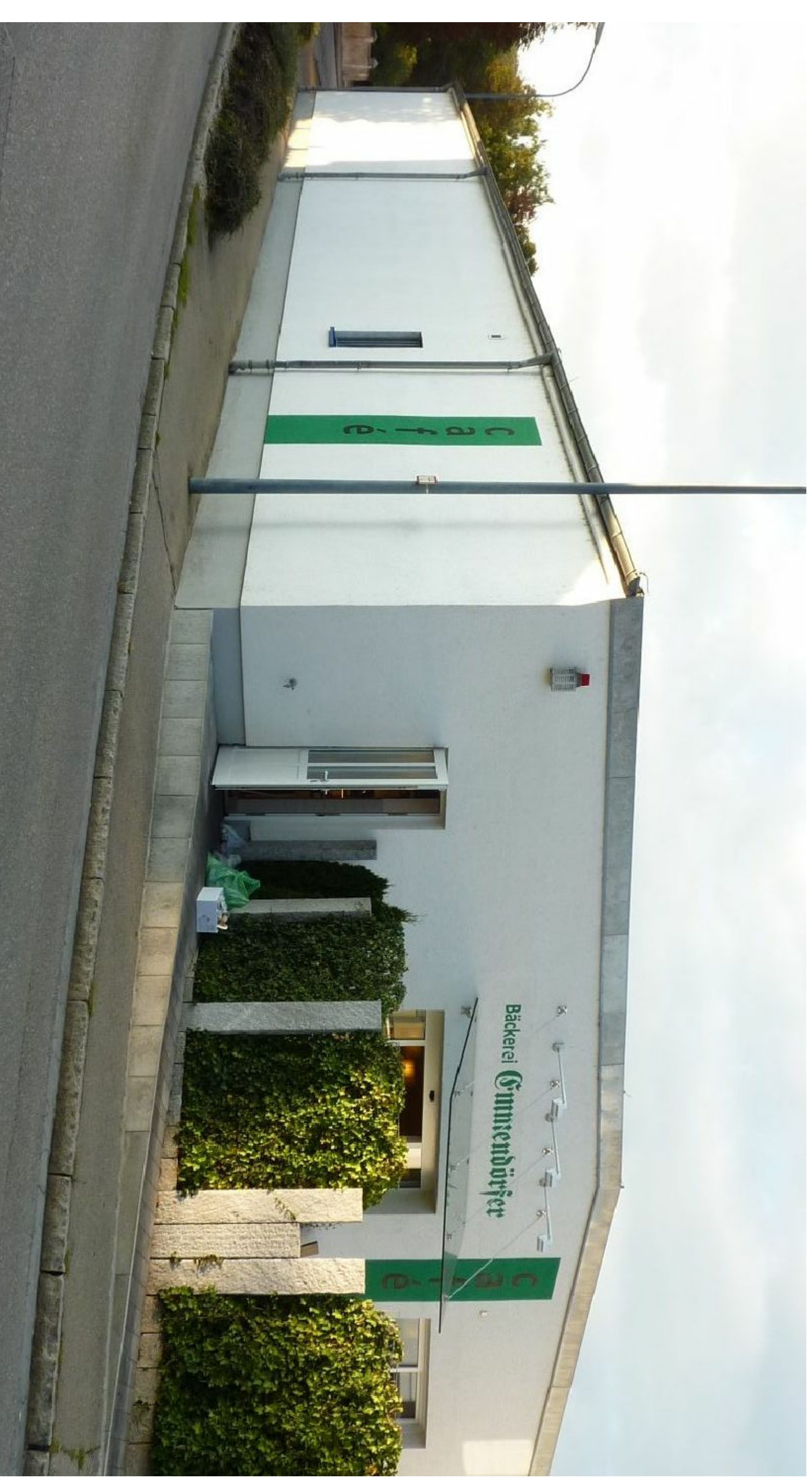
Anwesen Am Orgelhof 2